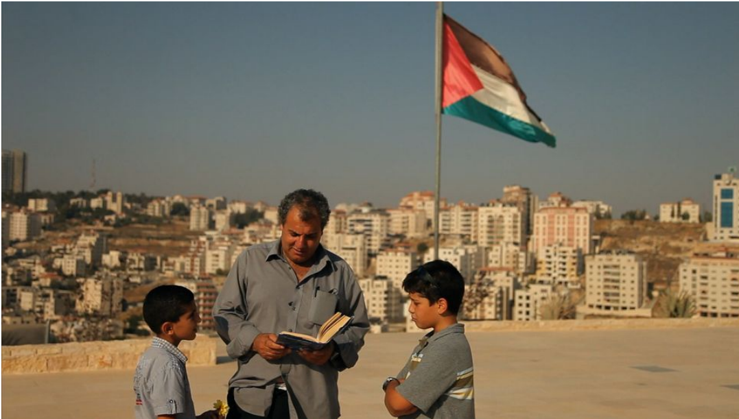
«This Is My Land», de Tamara Erde.

«Le système d'éducation palestinien est assez similaire à l'israélien.» Le point commun ? «Ignorer l'autre.»